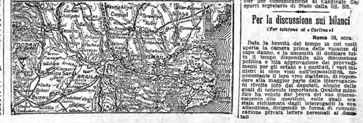
Per la discussione sui bilanci Roma 28, sera. Data la brevità del tempo in cui restò aperta la camera prima delle vacanze di capo d'anno...