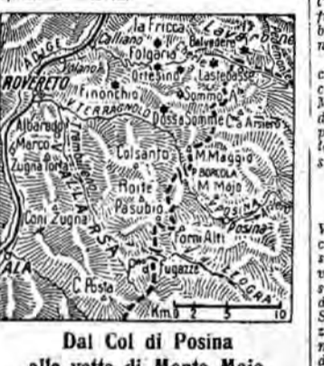
Dal Col di Posina alle vette di Monte Maio

Le operazioni inglesi in Africa... LONDRA 5, sera. - Il comunicato ufficiale sulle operazioni nell'Africa orientale dice: Un dispaccio da Smuts il 2 luglio, annunzia che il generale Vandenberg, che aveva proseguito l'offensiva, aveva cacciato il nemico da tutte le posizioni preparate nelle vicinanze di Kondoa e di Eragati.