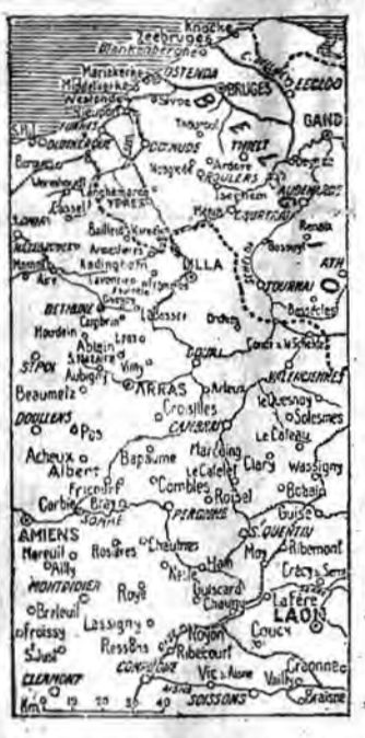
Le prime operazioni della grande offensiva

LONDRA 3, sera. - Il War Office annuncia che, per motivi di sicurezza generale, la circolazione fra l'Inghilterra e i continenti sarà svolta rigorosamente a raccomandazione di astenersi in ogni viaggio inutile e di assoggettarsi, senza sollevare difficoltà, alle richieste della Polizia per le perquisizioni delle persone e dei bagagli.