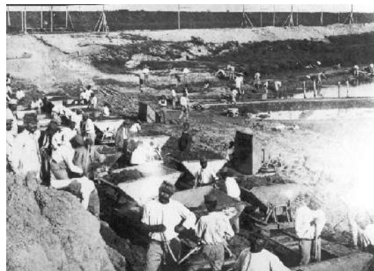
Prigionieri al lavoro nella pianura bolognese.

Nel novembre del 1916 il Ministero della Guerra inviò ai Prefetti una circolare contenente ulteriori specifiche sull'utilizzo dei prigionieri, chiarendo entità delle scorte, esenzioni per gli ufficiali, tipologia degli alloggi e del vitto per i prigionieri, orario di lavoro, "mercede" ai prigionieri, indennità spettante alla scorta. Erano norme severe, ma sostanzialmente eque, e rispettose delle necessità dei prigionieri, trattati in modo non certo peggiore rispetto ai comuni soldati di truppa italiani.