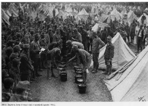
Rancio a Bagnara Arsa, 1916.

I primi contingenti arrivarono tra la fine luglio e i primi di agosto del 1917, vennero alloggiati nei granai indicati dalla Bonifica, ed avviati immediatamente al lavoro.