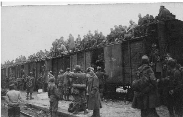
Militari austro-ungarici cercano di lasciare Bolzano il 2 novembre 1918. Per mancanza di combustibile non riusciranno a partire e saranno fatti prigionieri.

Questo accordo con le organizzazioni cooperative e sindacali dei lavoratori non si trovò; la questione fu dibattuta anche a livello centrale, discutendo su norme di sicurezza, possibile impiego di lavoratori provenienti da altre aree del paese, senza trovare soluzioni.