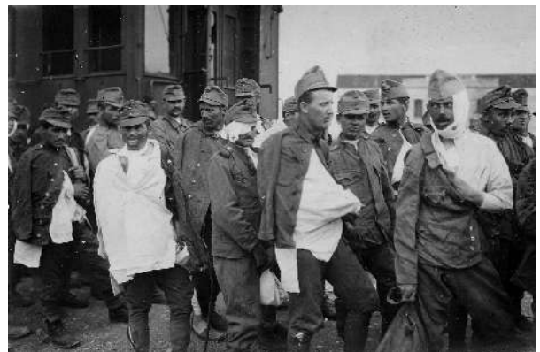
Feriti austriaci a Latisana (Udine). Museo civico del Risorgimento di Bologna