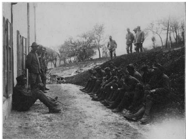
Prigionieri austriaci sul fronte dell'Isonzo. Museo civico del Risorgimento di Bologna

i prigionieri avrebbero intonato un miserere alla Italia dopo aver avuto comunicazione delle notizie dei giornali relative agli ultimi avvenimenti militari fra le nostre truppe con la coalizione Austro-Germano-Turco-Bulgara. Essi sono poi sempre informati delle notizie relative alla guerra dai giornali che liberamente si procurano. Il contegno indifferente delle autorità sarebbe in paese oggetto di severa critica.