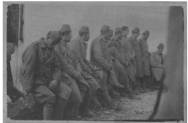
Prigionieri Bosniaci. Museo civico del Risorgimento di Bologna

Dagli atti redatti in quei giorni, appare evidente il risparmio derivante alle casse della Bonifica da questo accordo: dai 50 - 60 centesimi orari richiesti nel 1916 dalle cooperative dei terraioli si passò ai 25 centesimi corrisposti alla Commissione Prigionieri di Guerra per il lavoro dei prigionieri austro-ungarici, ai quali andavano 5 centesimi per ora lavorata cioè la stessa paga del soldato italiano in tempo di pace.