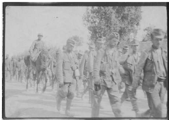
Prigionieri austriaci.

La situazione precipitò rapidamente: migliaia di profughi in fuga dalle regioni conquistate dal nemico si riversarono su Bologna, e tra loro non pochi erano i soldati sbandati fuggiti dal fronte. Ciò rischiava di innescare una situazione esplosiva. Il Prefetto di Bologna Vincenzo Quaranta si attivò dunque con il Comando del Corpo d'Armata di Bologna per l'immediato ritiro di tutti i prigionieri di guerra Austriaci, che, a tutela dell'ordine pubblico, secondo lui potevano essere vantaggiosamente sostituiti nei lavori agricoli dai profughi.