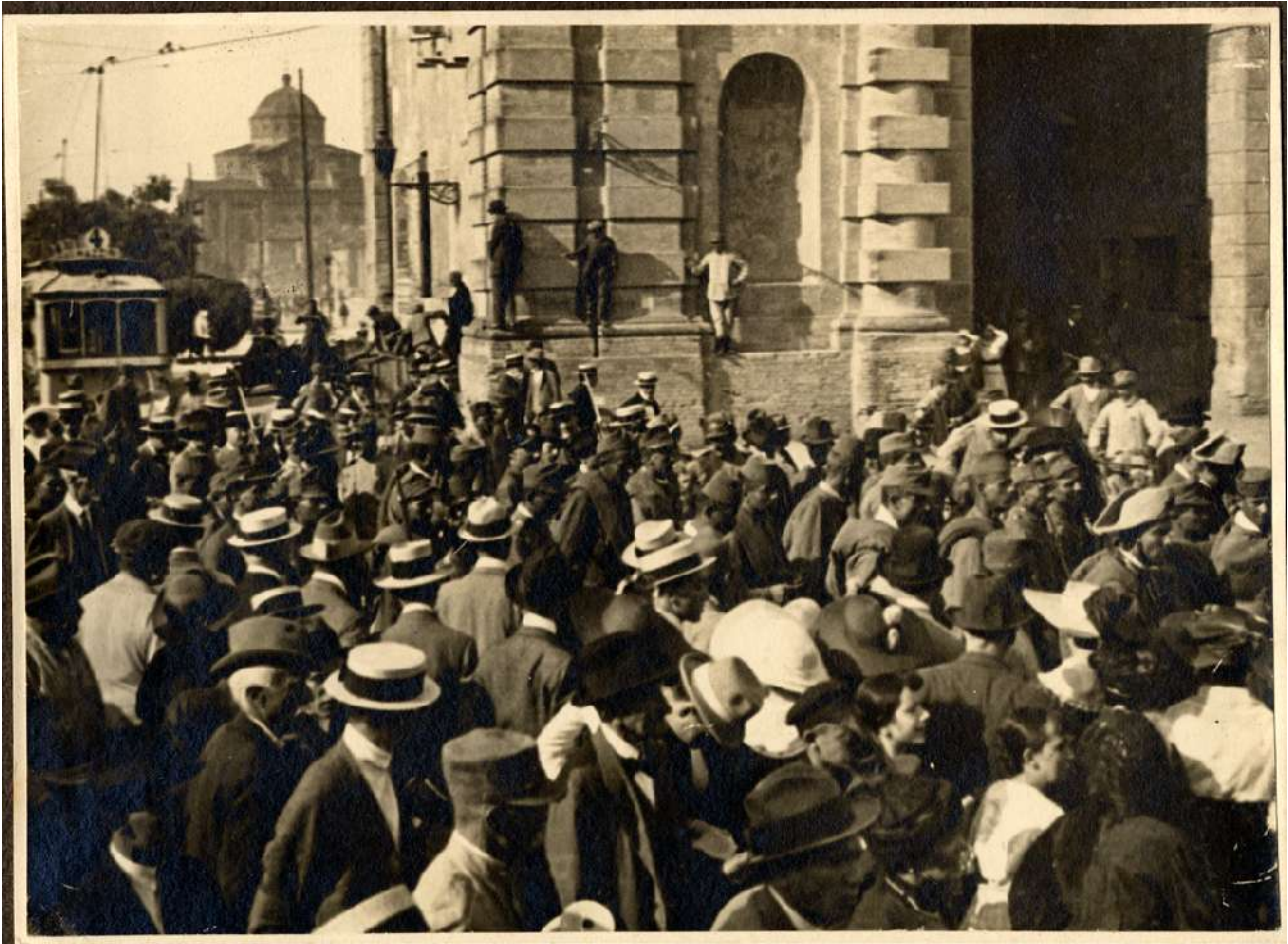
Prigionieri austro ungarici a porta Galliera, Bologna, 15 luglio 1916.

Molti furono i privati e gli enti che ricorsero a questa opportunità, ma quello senza dubbio più interessato risultò essere il Consorzio della Bonifica Renana, che aveva in corso grandi lavori di bonifica nelle valli del bolognese. Da una nota inviata da parte della Bonifica al prefetto il 2 marzo 1916 si apprende che per la provincia di Bologna erano al momento al lavoro 728 operai, 642 per la provincia di Ferrara e 27 per quella di Ravenna, per un totale di 1.397 uomini. Con il richiamo al fronte dei "suoi" operai, il Consorzio della Bonifica Renana si sarebbe trovato in difficoltà, e con prontezza si rivolse al Prefetto affermando che: