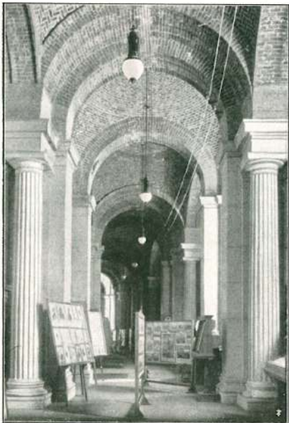
LA SALA CENTRALE DELLA MOSTRA.

Una pianta di Roma del 1798 porta segnata la nuova circoscrizione e la nuova nomenclatura dei rioni ordinate dai francesi; ed a poca distanza figura tutta la pleiade dei generali francesi: Berthier, Massena, Championnet, Macdonald, Augerau.