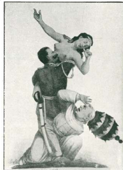
IL RATTO DELLE SABINE (CARICATURA).

" Roma pertanto è dichiarata con Superiore au- " torizzazione in Stato d'Assedio e i pacifici e