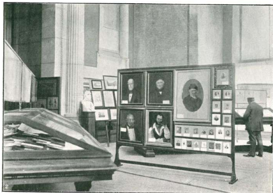
PRIMA SALA - PARLAMENTO MARCHIGIANO E CIMELI LEOPARDIANI.

Ma Pio IX, che aveva tanto insistito sulla fedeltà delle promesse, ringoiò ben presto tutti i suoi buoni propositi.