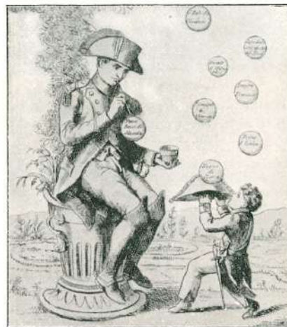
UNA CARICATURA SU NAPOLEONE I.

" onesti cittadini sono invitati a rimanere tranquil- " lamente alle case loro, onde la truppa possa in- " vigilare sui pochi male intenzionati, che cercas- " sero turbare l'ordine e attentare alla pubblica " sicurezza ».