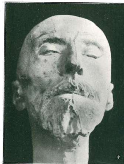
MASCHERA DI MAZZINI.

« Roma 1848. Tipografia della Rev. Camera Apostolica ..