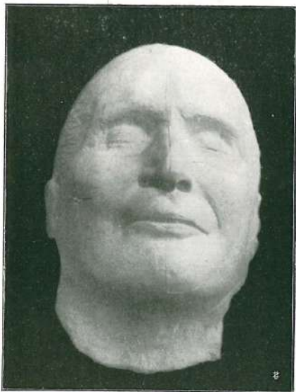
MASCHERA DI PIO IX.