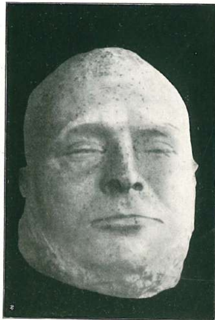
MASCHERA DI CAVOUR.

Una raccolta preziosa è stata ordinata su Giuseppe Gioacchino Belli, il poeta dialettale roma-