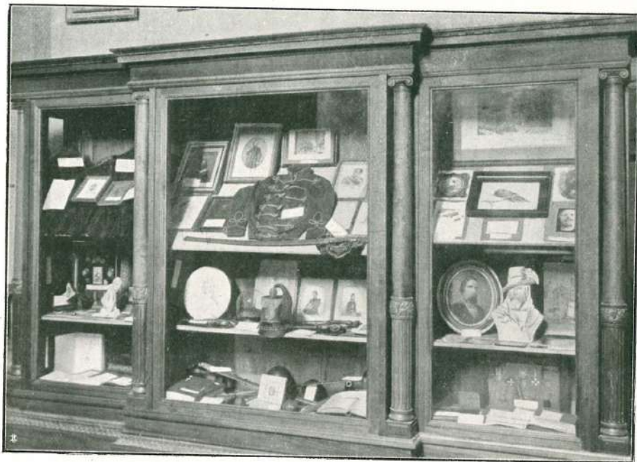
CIMELI MILITARI DELLA REPUBBLICA ROMANA DEL 1849.