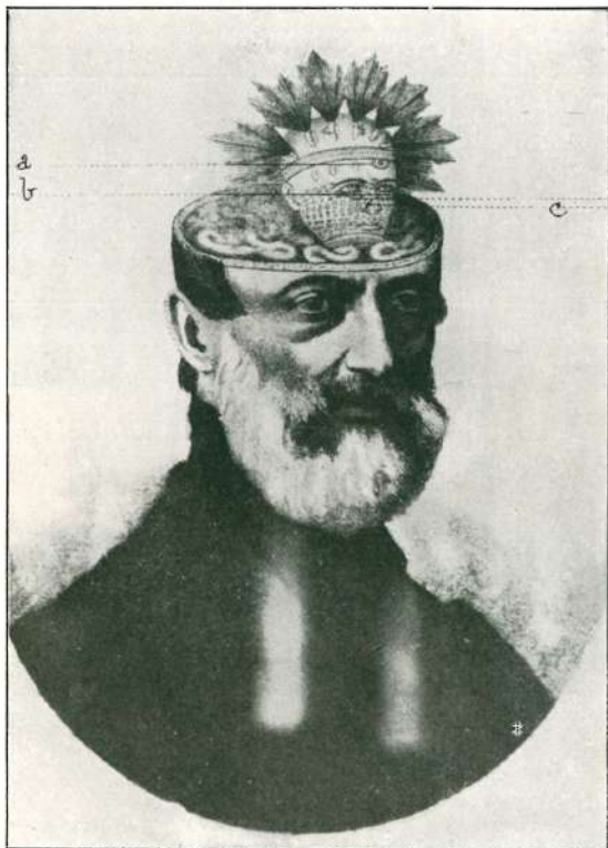
RITRATTO PSICOGRAFICO DI GIUSEPPE MAZZINI

" Ore 3.10. I francesi sembrano disanimati.