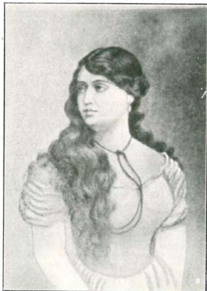
RITRATTO DI ANITA GARIBALDI.

« Romani! La mattina del 20 settembre 1870 segna una data delle più memorabili nella Storia.