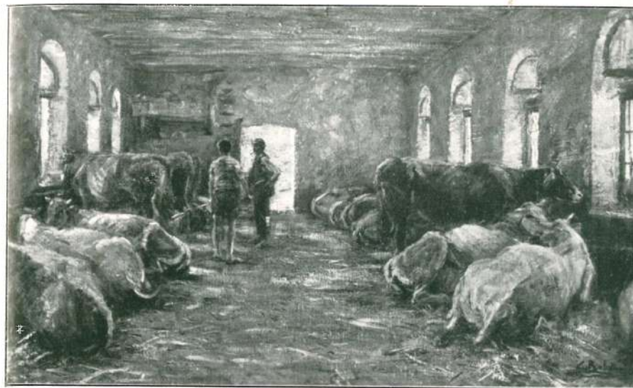
STALLA DI MUCCHE IN LOMBARDIA.