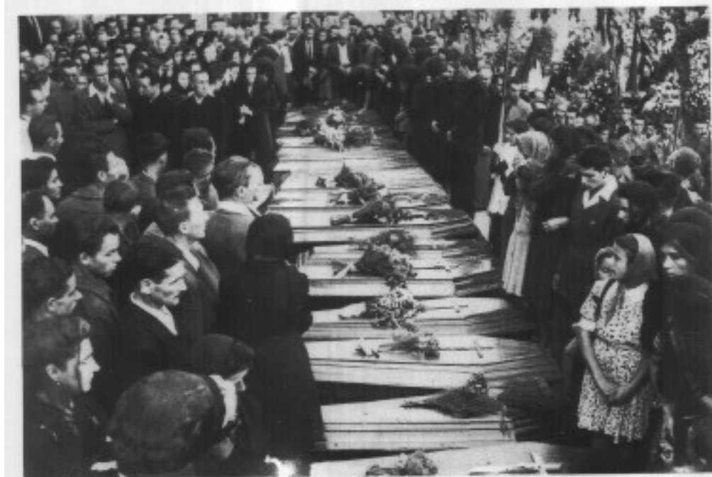
Fine aprile e agosto 1945: funerali dei partigiani caduti a Cavezzo e a Sabbiuino.