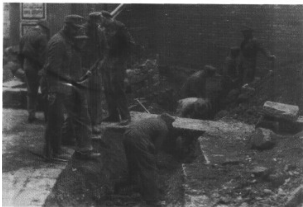
Prigionieri tedeschi al lavoro.